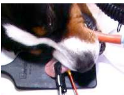
Abbildung 3: Anwendung einer konventionellen Neutralelektrode unter der Zunge. Zusätzlich ist der Sensor des Pulsoximeters an der Zunge befestigt. Die Applikation auf der Zunge weist zwar grundsätzlich günstige Impedanzverhältnisse für eine Neutralelektrode auf, aber aufgrund der nicht definierten Kontaktfläche, der unsicheren Befestigung und des fehlenden Neutralelektroden-Anlage-Monitoring, kann diese Applikation zu Verbrennungen auf der Zunge führen (zweigeteilte selbstklebende Einmalelektroden scheiden hier aus)