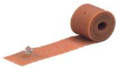
Abbildung 1: Elastisches Gummiband zur Befestigung, 100 cm (HF 9561)